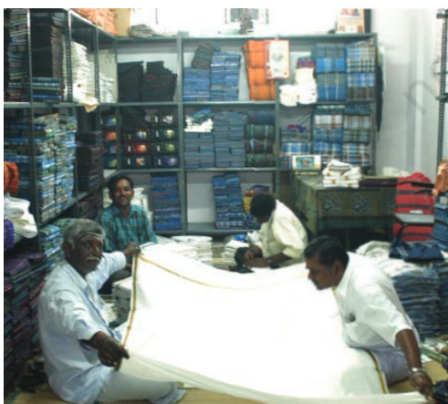
इरोड में एक दुकान

तमिलनाडु में सप्ताह में दो बार लगने वाला इरोड का कपड़ा बाज़ार संसार के विशाल बाज़ारों में से एक है। इस बाज़ार में कई प्रकार का कपड़ा बेचा जाता है। आसपास के गाँवों में बुनकरों द्वारा बनाया गया कपड़ा भी इस बाज़ार में बिकने के लिए आता है। बाज़ार के पास कपड़ा व्यापारियों के कार्यालय हैं, जो इस कपड़े को खरीदते हैं। दक्षिणी भारत के शहरों के अन्य व्यापारी भी इस बाज़ार में कपड़ा खरीदने आते हैं।