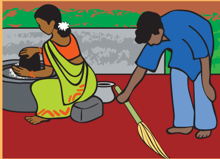
वेणु का परिवार